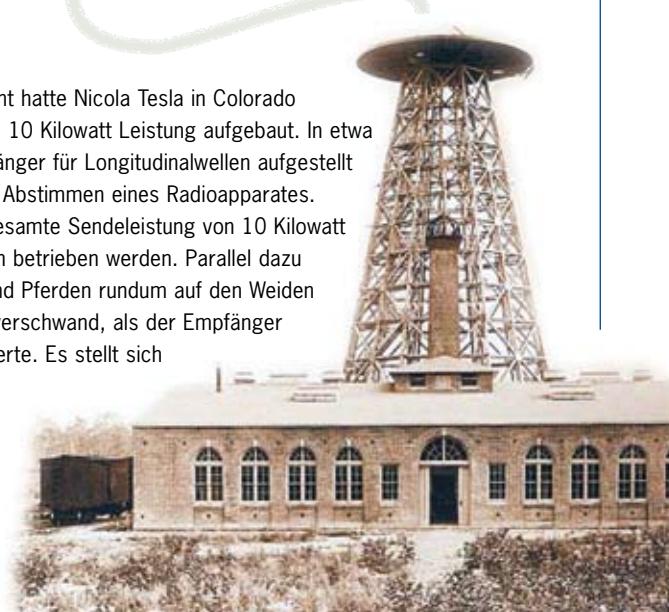
Nikola Tesla in seinem Labor in Colorado um 1900

In einem etwa im Jahre 1890 durchgeführten Experiment hatte Nikola Tesla in Colorado Springs in den USA einen Longitudinalwellensender von 10 Kilowatt Leistung aufgebaut. In etwa 40 km Entfernung auf einer Anhöhe hatte er einen Empfänger für Longitudinalwellen aufgestellt und mit dem Sender in Resonanz gebracht, ähnlich dem Abstimmen eines Radioapparates. Nachdem der Empfänger abgestimmt war, konnte die gesamte Sendeleistung von 10 Kilowatt empfangen und damit eine ganze Batterie von Glühlampen betrieben werden. Parallel dazu trat ein sehr merkwürdiges Phänomen an den Rindern und Pferden rundum auf den Weiden auf. Sie zeigten ein völlig anomales Verhalten, das erst verschwand, als der Empfänger abgestimmt war und die gesamte Sendeenergie absorbierte. Es stellt sich hier die Frage, was mit uns Menschen und der belebten Natur insgesamt geschieht, die wir flächendeckend solchen Longitudinalwellen ausgesetzt sind, wenn auch mit geringerer Intensität als in dem historischen Experiment von Nikola Tesla.