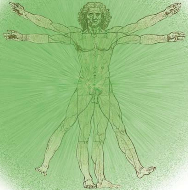
Messungen mittels Elektroakupunktur offenbarten erstaunliche Zusammenhänge, zum Beispiel dass Menschen Strahlen förmlich anziehen.

Im dritten Experiment zeigte sich, dass die untersuchte Strahlung durch eine Wasserschicht von etwa 2,5 cm Dicke abgeschirmt werden kann. Ein betroffener Elektrosensibler, der zwischen sich und dem fraglichen Mobilfunksender Laubbäume stehen hatte, beobachtete, dass es ihm im Sommer besser ging als im Winter, wenn die Bäume kahl waren. Misst man die durch Mobilfunk erzeugte Auf-