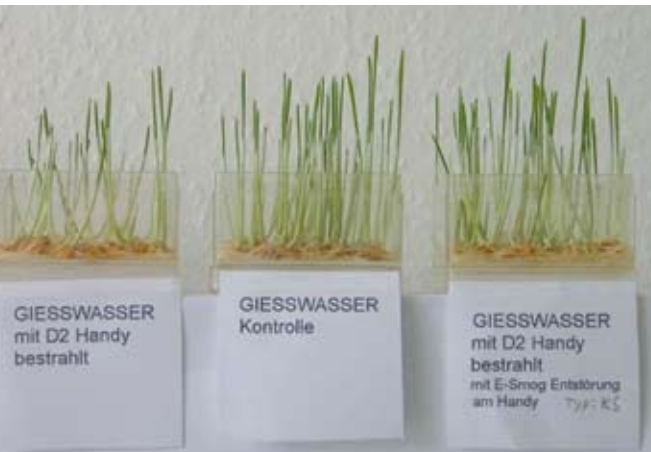
Mit Mobilfunk bestrahltes Gießwasser lässt Weizenkeimlinge nur kümmerlich wachsen. Wird die Strahlung dagegen ent-stört, bleibt das Wachstum normal.