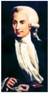
Wegbereiter der Elektrochemie: Luigi Galvani, 9.9.1737–4.12.1798, italienischer Arzt, Anatom und Biophysiker.

E lektromagnetische Felder sind in unserer modernen Zivilisation allgegenwärtig und nehmen laufend an Intensität zu. Gegenüber den schon immer vorhandenen natürlichen elektromagnetischen Feldern sind die künstlich erzeugten Felder in bestimmten Frequenzbereichen millionenfach stärker. Die Wissenschaft beschäftigt sich seit der Entdeckung der Elektrizität und dem Galvani-Versuch im 18. Jahrhundert am Froschschenkel mit der biologischen Wirkung elektromagnetischer Felder. Verstärkte Aufmerksamkeit erregte dieses The-